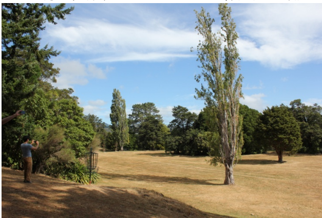
ハーコート・パーク