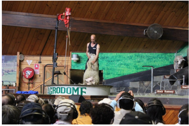
アグロドームのシープショー