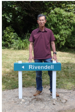
カイトケ・リッジヨナル・パーク