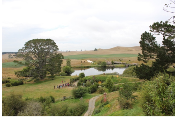
バースデーパーティー会場