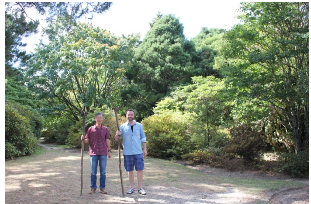
ハーコート・パーク