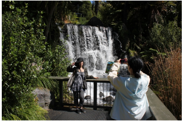
レインボー・スプリングス