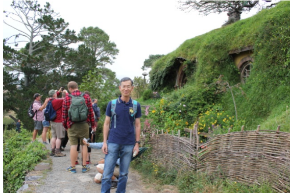
お山の下の袋小路屋敷 (ビルボの家)